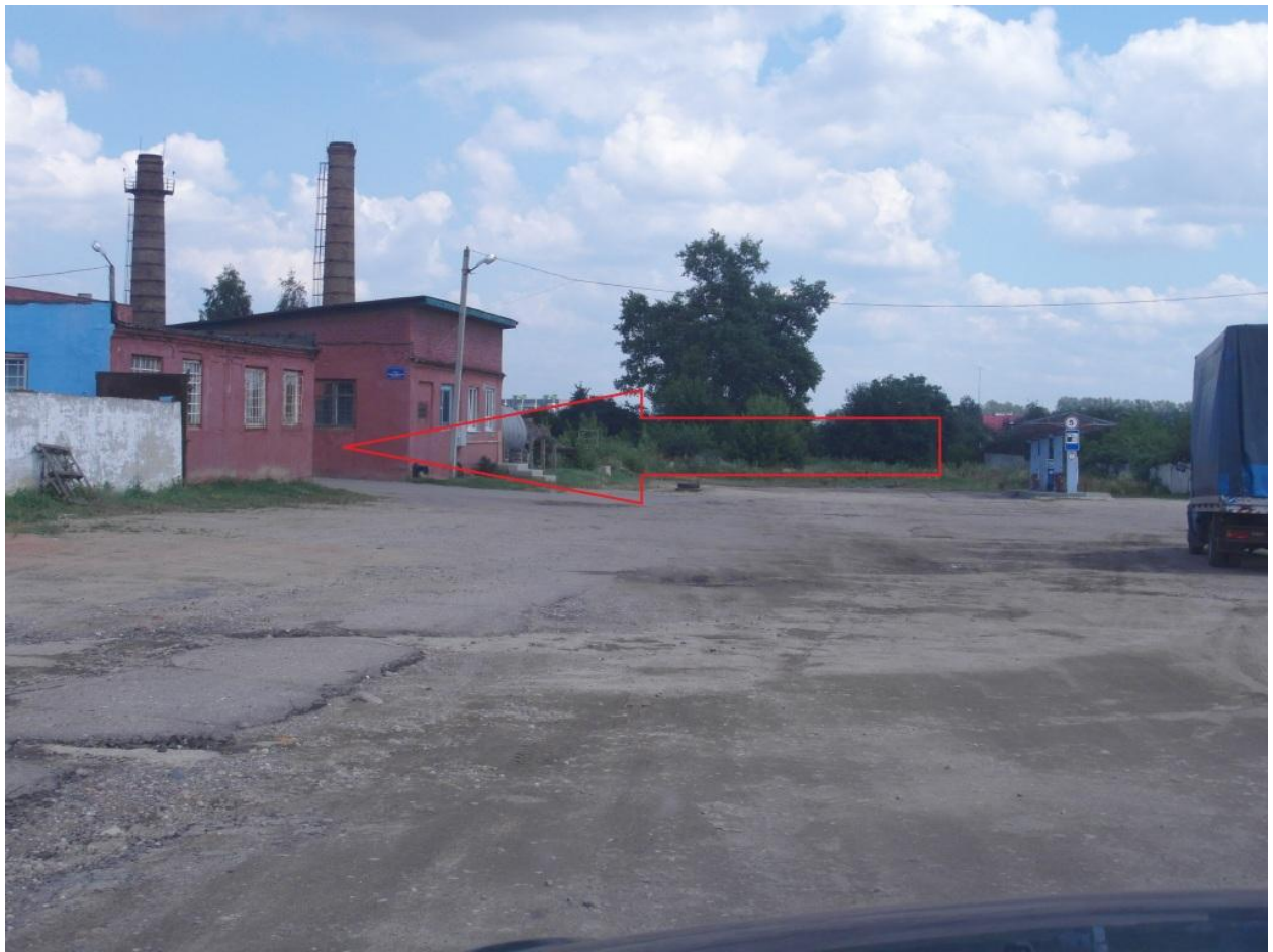
Вы на площадке СТО Автореабилитация